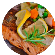
Salmone Lachs 18,90