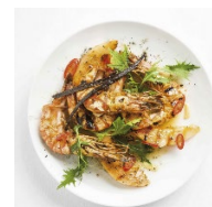
Scampi Riesengarnele 26,90

Beilagen: frisches Tagesgemüse - geröstete Bratkartoffeln