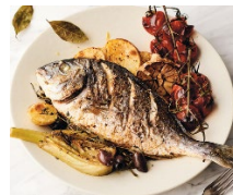
Dorade Doradenfilet 20,90