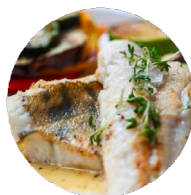
Lucioperca Zanderfilet 19,90