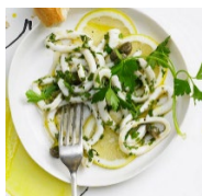
Calamari Tintenfisch 14,90